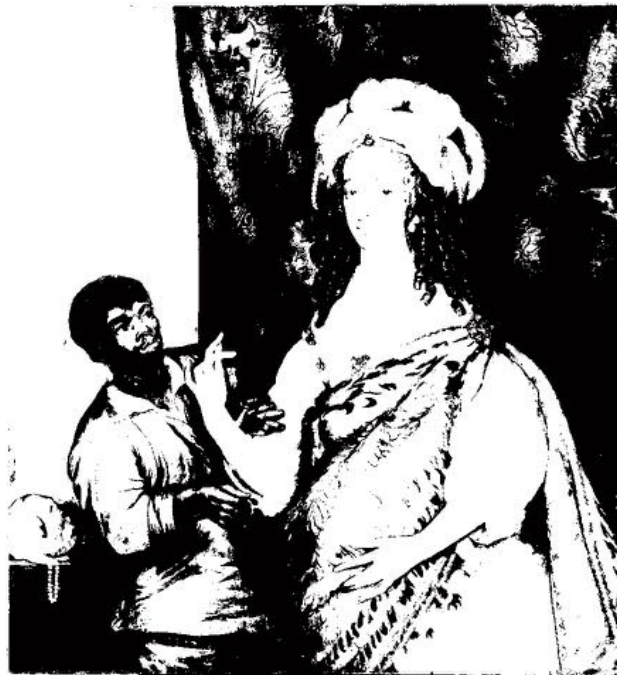
Adriaen Hanneman, Postuum portret van Maria I Stuart met een dienstbode , ca. 1664. Olieverf op doek. Mauritshuis, Den Haag.