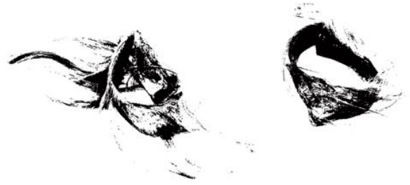
Paar kuitbanden. Indonesië. Voor 1889. Huid, rotan. Koninklijk Zoölogisch Genootschap Natura Artis Magistra. Tropenmuseum, Amsterdam.

Bij de registratie en documentatie van objecten wachten ons talloze uitdagingen. Ongetwijfeld verschillen die voor verschillende musea en collecties. Natuurlijk hebben wij, net als andere musea, problemen met verouderde en beledigende termen; we zouden zelfs kunnen stellen dat dit soort uitdagingen binnen de etnografische musea groter zijn dan bij de meeste andere musea. Ik wil het echter hebben over andere subtiele maar belangrijke kwesties, eveneens gerelateerd aan tijd en perspectief: de juiste keuze voor het gebruik van bijvoorbeeld de tegenwoordige of verleden tijd bij het beschrijven van objecten, en het gebruik van verkleinwoorden.