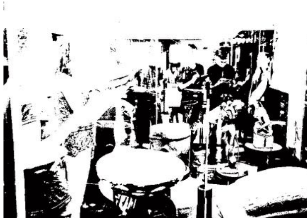
Rondleiding in het Tropenmuseum, 4 juni 2015; Kirsten van Santen (fotograaf)

Binnen educatieve programma's gaat het niet alleen om woorden die gevoelig of discriminerend zijn, waarvan er meerdere in deze publicatie besproken worden. Soms kan de problematiek rondom taal veel subtieler en onverwacht zijn en wordt een doodgewoon woord gecompliceerd.