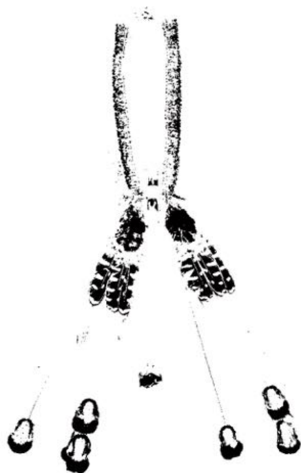
Ceremoniële borstversiering voor mannen (Wirahukang). Brazilië. ca. 1950. Been, katoen, veer. Museum Volkenkunde, Leiden.

Het Ka'apor volk uit het noordoostelijk Amazonegebied noemt zichzelf Ka'apor. Van oudsher worden deze mensen in onze literatuur en database echter Urubú genoemd, wat 'aasgieren' betekent. Deze naam kregen ze van hun Luso-Braziliaanse vijanden, tegen het einde van de 19de eeuw. Hoewel de Ka'apor 'Urubú' als een negatieve benaming zien, wordt de term in de literatuur tot op heden gebruikt. Vrijwel alle volken uit het Amazonegebied staan voor vergelijkbare uitdagingen.