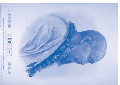
Wandplaten voor onderricht in de antropologie, ethnografie en geografie, door W. von Steiner (naar foto van prof. dr. M. Fütterer), ca. 1905. Kleuren lithografie op papier, Tropenmuseum, Amsterdam.