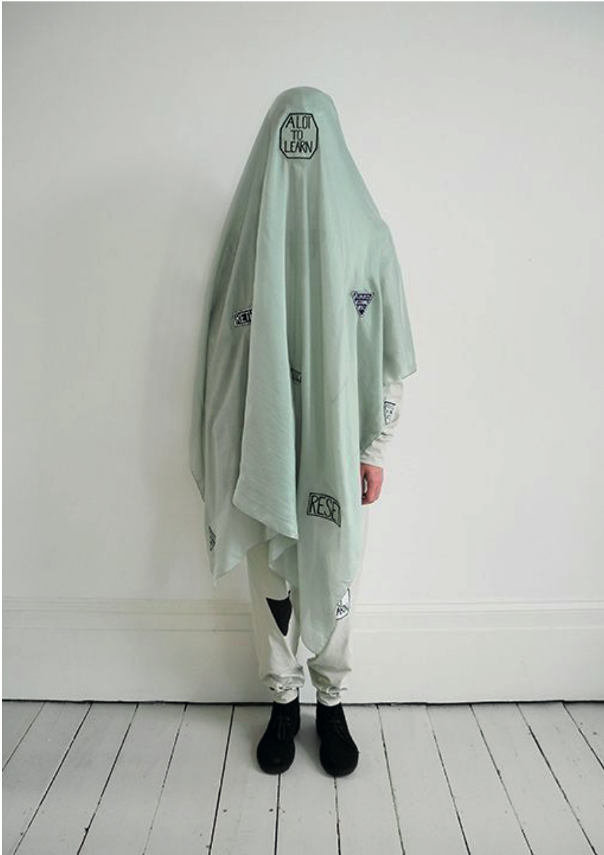
Het oogt mysterieus en straalt anonimiteit uit.